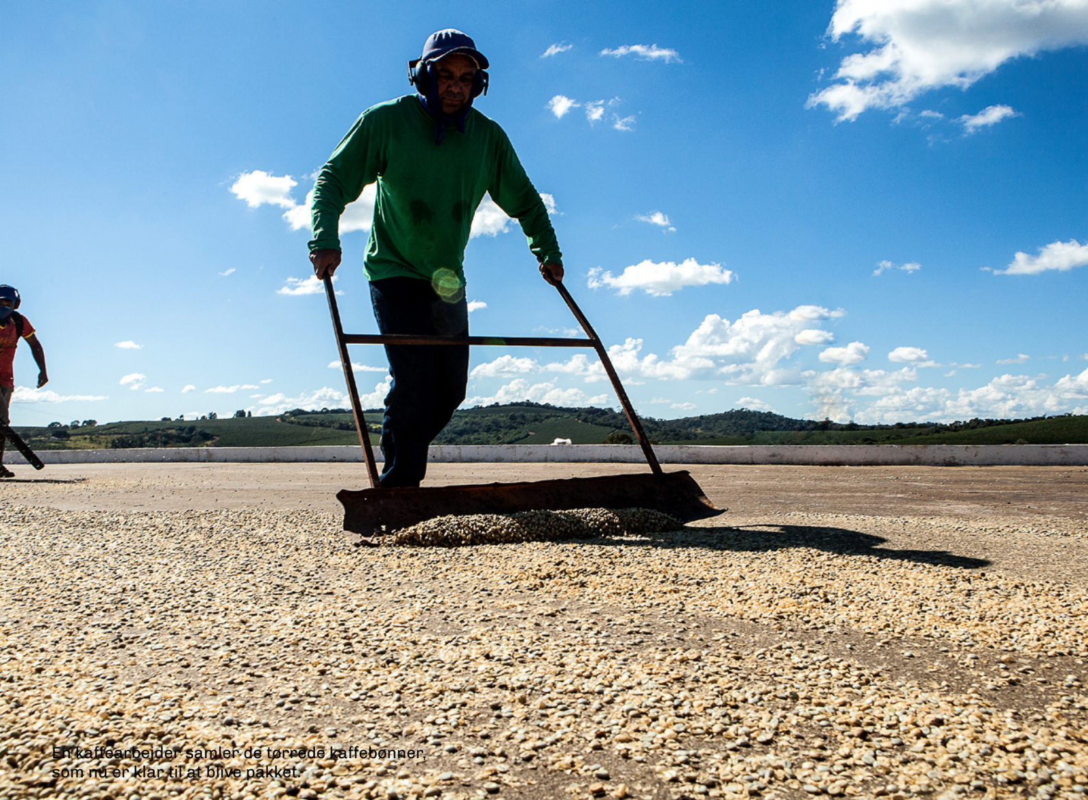
En kaffearbejder samler de tørrede kaffebønner, som nu er klar til at blive pakket.